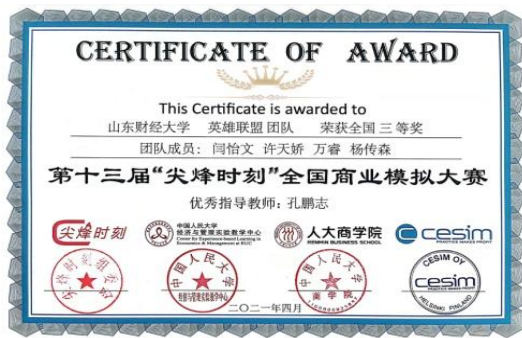
2021 年尖峰时刻全国商业模拟大赛全国三等奖